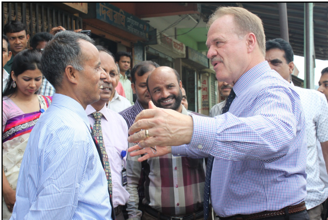
Picture 26: At Good Bye, Ambassador Mozena promised to come back to ISKCC again.